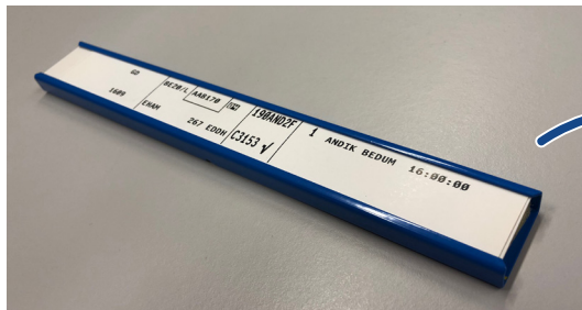
Papieren Flight Strips