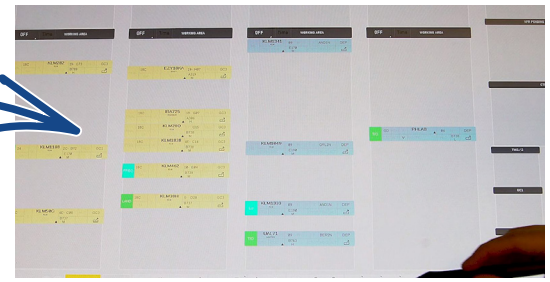
Electronic Flight Strips